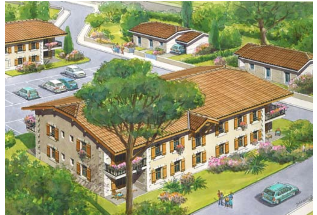
Illustration de la résidence le Clos du Val de Garonne