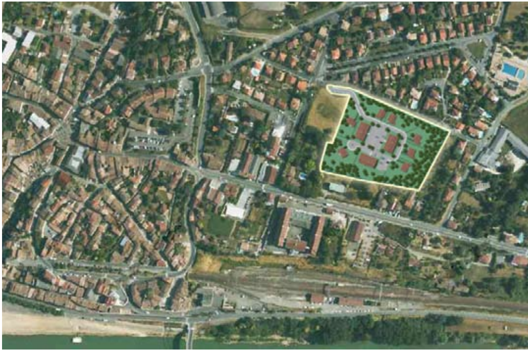
Vue aérienne de La Réole